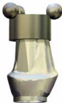
(1) Scan Body I.P.F.

Simbiosi has been developed for supplying to those working in the implant field (Dentist - Dental Technicians - milling center) to achieve a complete denture on implants, on CAD modeling techniques with adhesive bonding of interfaces, or manually using the technique of wax lost.