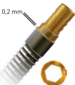
con ingaggio / no rotational / antirotationnel