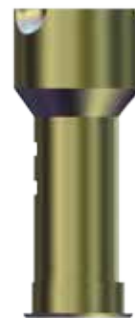
(2) Scan Body Unico

Simbiosi a été développé afin d'offrir aux professionnels du secteur implantaire (chirurgiens dentistes, prothésistes dentaires, centres d'usinage) un système complet leur permettant de réaliser des structures sur implant en utilisant soit la technologie CAD de modélisation avec une technique de scellement des interfaces, soit manuellement par la technique de coulée à cire perdue.