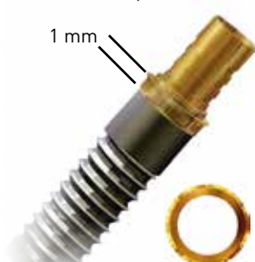
no ingaggio / rotational / rotationnel